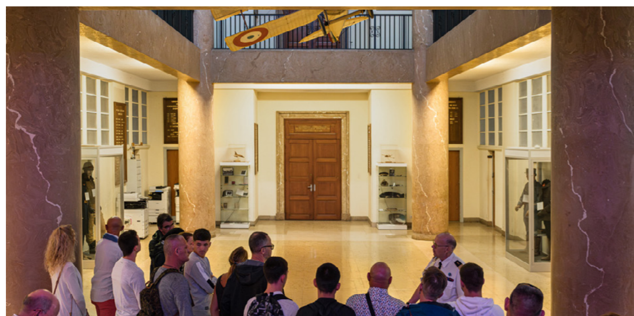
Remplacement des anciennes vitrines par des vitrines électrifiées, sur roulettes et permettant de préserver les objets de la poussière