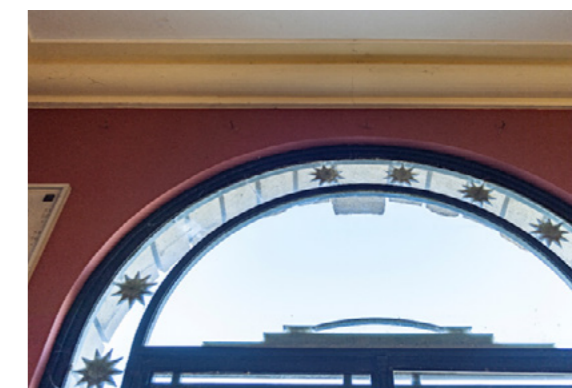
Besoin de multiples reprises sur les ferronneries. Deux étoiles sont tombées.