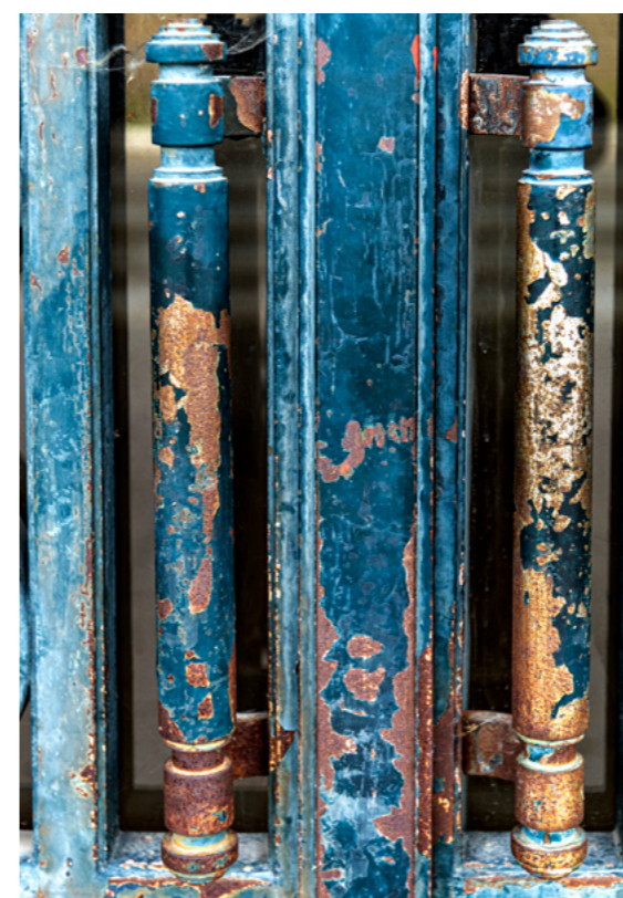
Détails des portes monumentales de la salle des marbres : ferronneries extérieures corrodées.