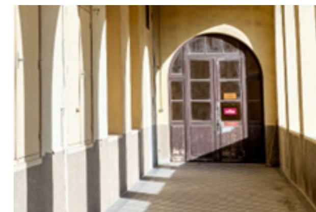
Coursives hautes : anciennes fenêtres à combler, porte à changer