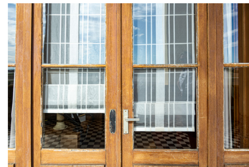
Coursives hautes : porte du bureau du général