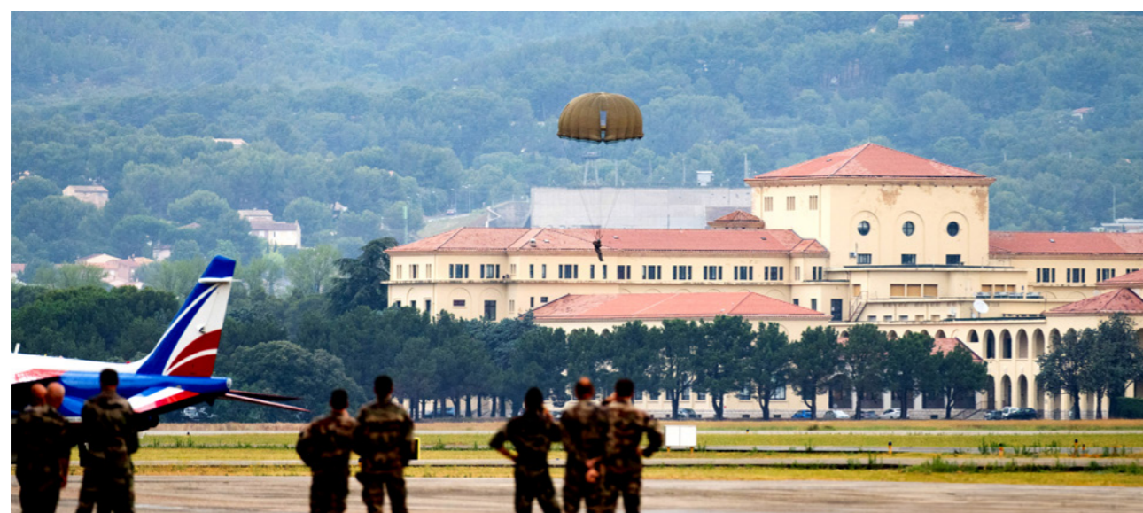
Vue d'ensemble de la façade Sud