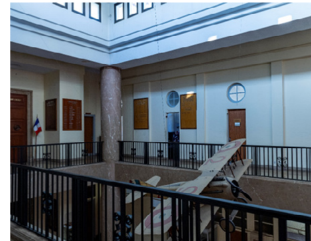
Temple haut : portes à changer, peintures à reprendre