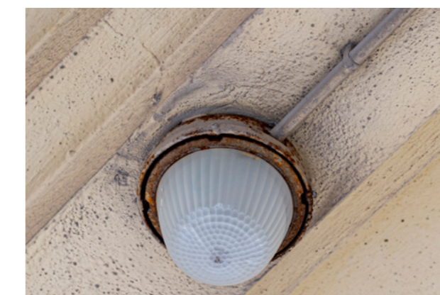
Dépollution éclairage extérieur nécessaire