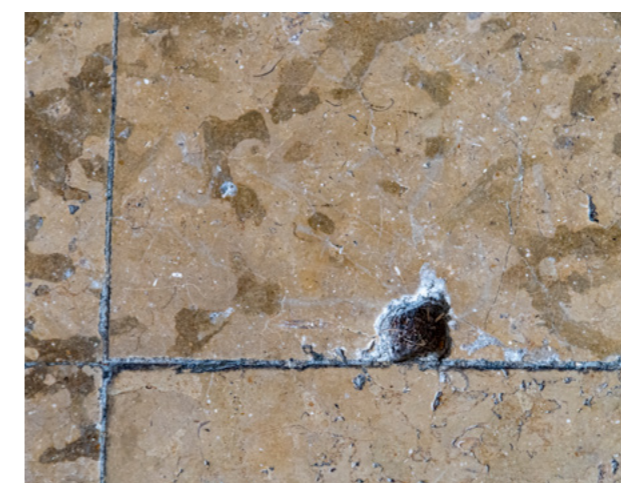
Temple bas : sol à rénover