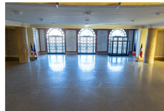
Sens d'ouverture des portes à inverser pour raison de sécurité