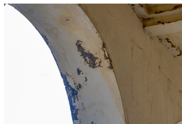
Coursives hautes (enduit et peinture reprise nécessaire)