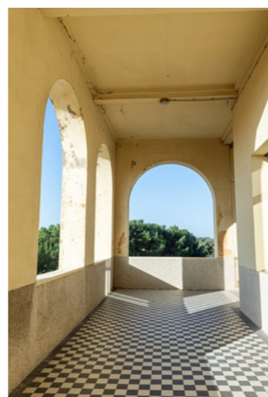
Coursives hautes : peintures et sols à rénover