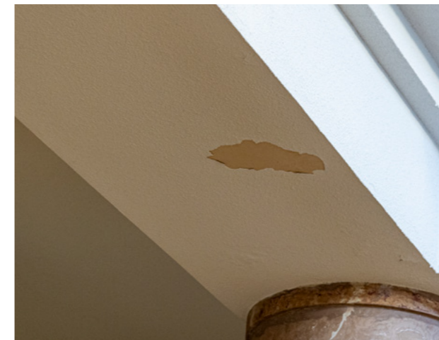
Temple bas : peinture à reprendre