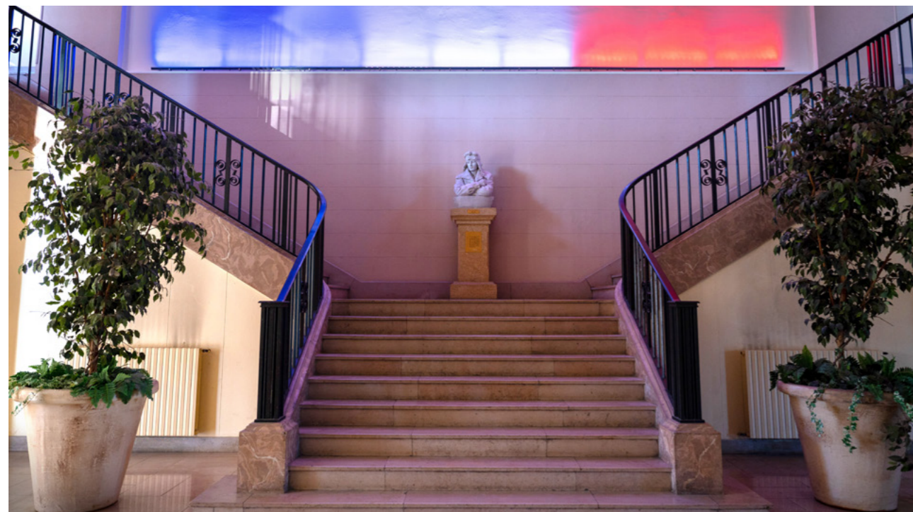
Montée d'escalier dans le temple : reprises des murs et peintures nécessaires