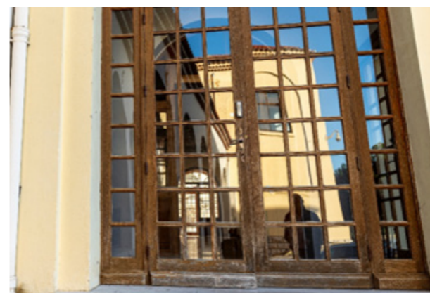
Coursives basses : porte d'entrée à changer