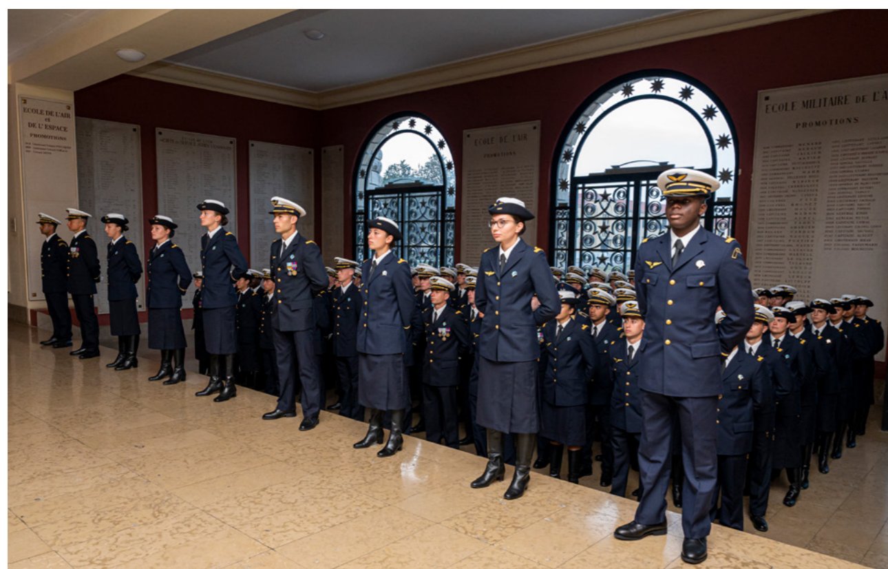
Vue d'ensemble de la salle des marbres à l'occasion d'une cérémonie de remise des poignards.