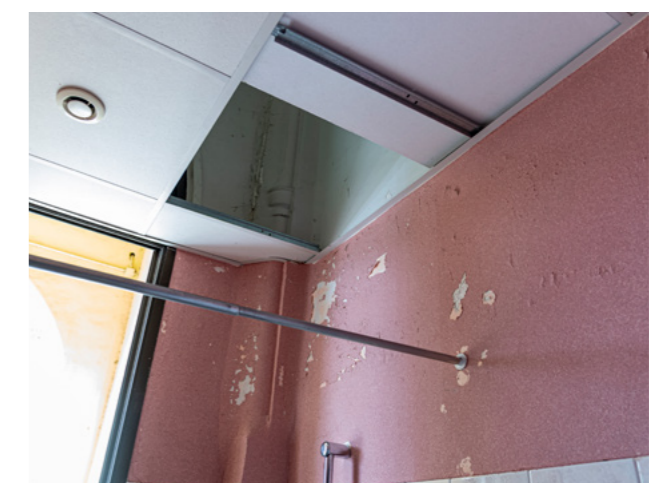
Temple bas : sanitaires à rénover