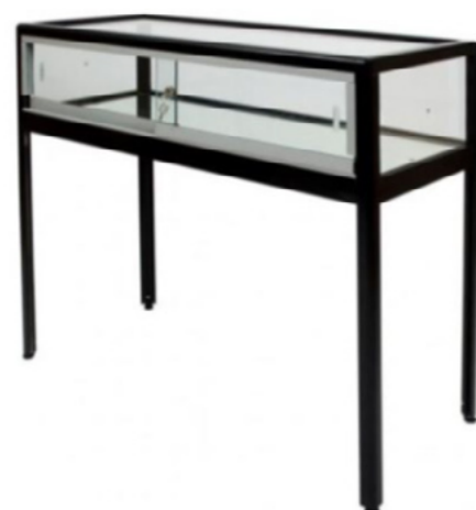
Vitrine table d'exposition